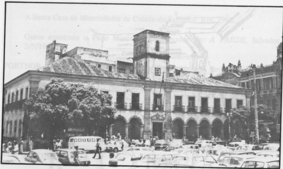
A Casa da Câmara, construída segundo o projeto do arquiteto Marcos da Mesquita Ferreira.