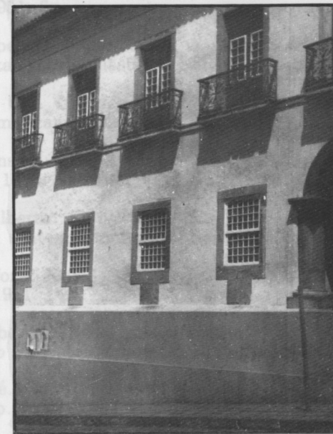
Vista lateral esquerda da Casa da Câmara (repare os "lenços" de pedra de cantaria debaixo das janelas).